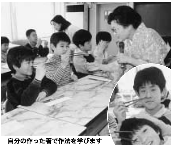
自分の作った箸で作法を学びます