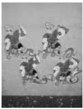
絹本着色舞楽図六曲屏風(部分)

●決まりました 平成12年度 区指定・登録文化財 室町時代末期の作で、「春鶯囀」(写真)「打毬楽」など二種の舞楽を各扇に描いています。舞楽が景観の一部から絵の主題へと変化する過渡期の作品で、近世に廃絶した舞楽の所作や装束などを記録した図譜としても貴重なものです。