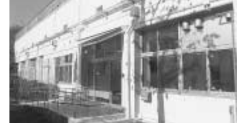
方南ふれあいの家(入口)