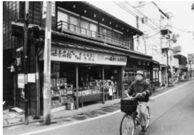
妙法寺の門前には、昔ながらのお店も