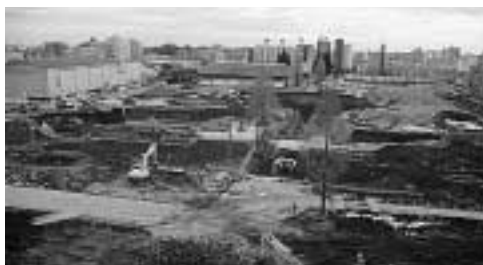
北側から工場跡地浄化工事現場を望む

日産に対し、引き続き、透明かつ最善の対策をとるよう厳しく求めるとともに、監視・指導を行ってまいります。土壌については、今後も