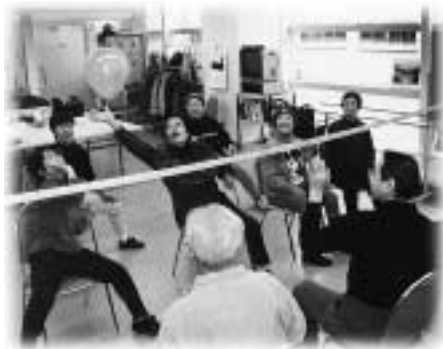
楽しく風船パレー

「演奏したり、ものを作ったりと趣味がふえました」「夫が亡くなってから、外出する気にもなれず寂しい思いをしていましたが、参加してからは外出する機会も増えて、毎日が楽しいです」。皆さん、活動日を心待ちにしているようです。