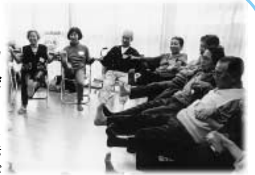
家族と一緒に体操します

銀の会のメンバーの中には、以前家族を介護していた人もいます。「この会は、主人を介護していたときにお世話になっていました。主人が亡くなった今でも、会に来ることが楽しみなんです。介護を家族だけで続けるのは辛いもの。同じ立場の人たちが集まって情報交換をしたり、励ましあったり、地域の大切な交流の場となっています。」