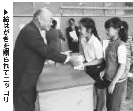
▶絵はがきを贈られてニコニコ

今年3月、五年生の児童一四名がオシドリ観察のために日野町を訪問。昨年10月の鳥取県西部地震で最も強い揺れが観測されたことから、義援金としてお小遣いや家族にカンパしてもらったお金を持っていき、地元新聞に「オシドリ大使」として取り上げられるほどの歓迎を受けました。