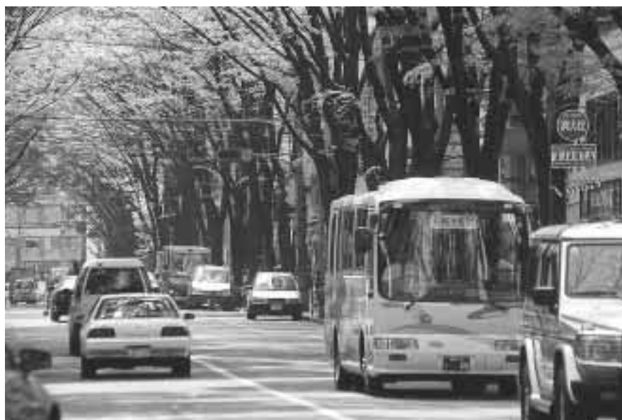
多くの意見が寄せられた南北バス「すぎ丸」

区では、皆さんからの区政に対するご意見、ご要望を可能な限り反映していけるよう、より開かれた区政の推進に努めています。区政について、お気づきの点がありましたら、お気軽に意見をお寄せください。問い合わせは、区政相談課へ。