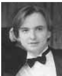
ウラジミール・ミシュク

【曲目】第一部「ベートルベン交響曲第五番「運命」」第二部「歌とスペイン舞踊とおはなしてつづるピゼーの音楽物語「カルメン」」第三部「日本フィルの演奏にのってみんなでうたおう「気球にのってどこまでも」ほか【定員】108名【入場料】大人3000円、子ども(4歳以上、高校生まで)1500円(全席指定・会員割引あり)【予約前売開始】5月21日(月)午後1時