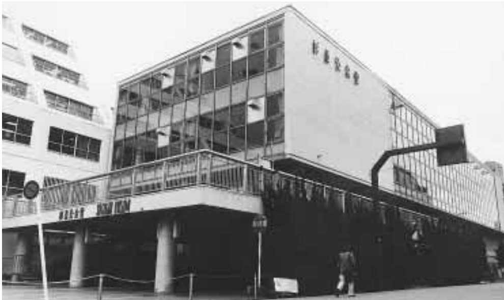
現在の杉並公会堂(上萩1 23 15)