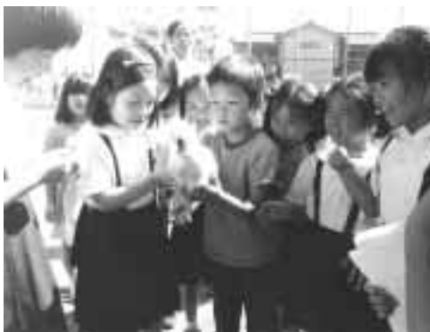
そつと抱いてみてね

杉一小の代表の子が「えさはキャベツを刻んであげてください」など、実物を見せながら世話を説明します。実際に鳥骨鶏を取り出されると、なれていない朝鮮第九の子どもたちは怖がりしてしりこみし、中には逃げ出す子も。そこで杉一小の子が「大丈夫だよ、後ろからそつと抱いてあげて」と教えてあげると、それをきつかけに仲良しの輪ができました。