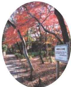
成田西 いこいの森