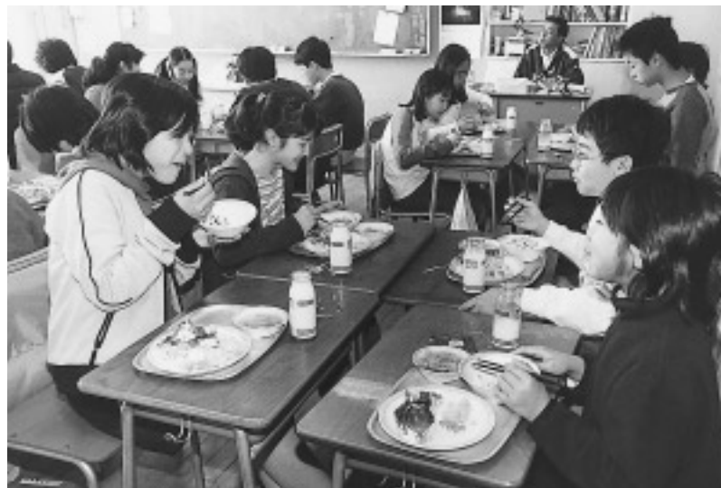
自分たちがリクエストしたおかずで最後の給食