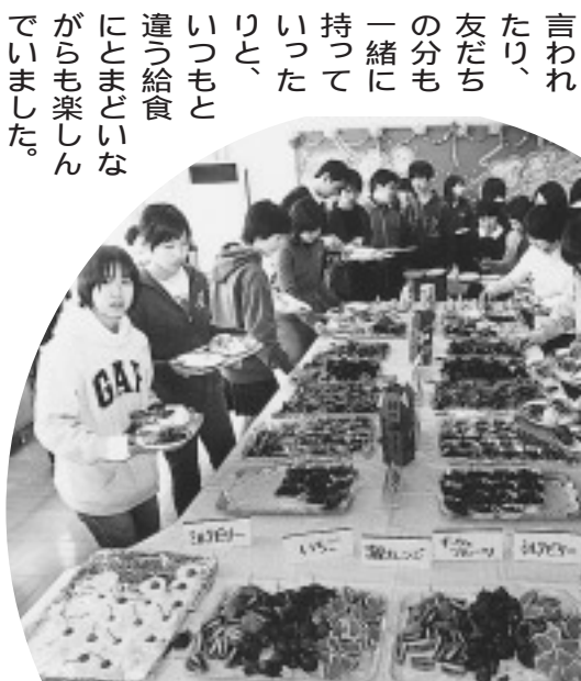
▲自分で考えながら選びます

最初は全種類一品ずつ、というルールにもかかわらず、つい好きな物だけ取ってしまった後で戻すように