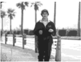
映画「故郷 ふるさと」