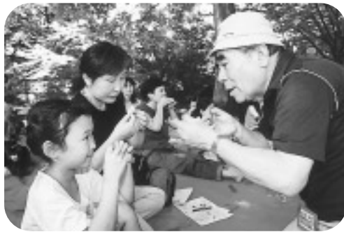
うまくふけるかな