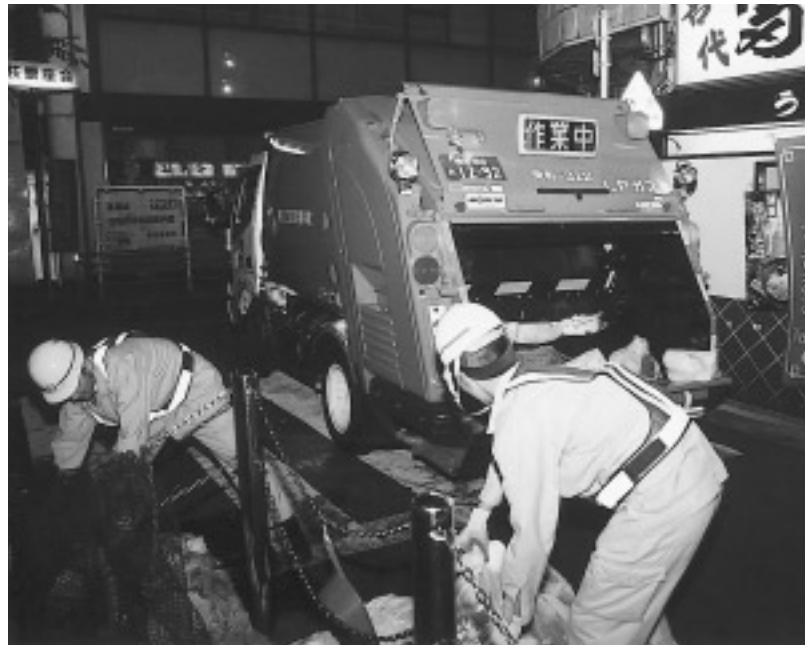
▶6月から始まった「夜間収集モデル事業」