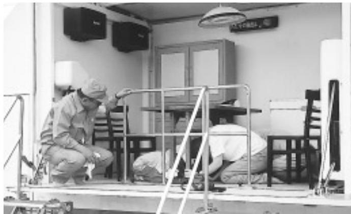
起震車で大地震を体験

【時間】午前9時～11時30分ごろ 【場所】宮前中学校(宮前2 12 1)ほか1カ所 【内容】震災救援所運営、仮設トイレ設置、給水、救援物資搬送、医療救護訓練、炊出し訓練など