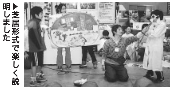
芝居形式で楽しく説明しました 自分たちで考えた発明も発表

問い合わせ先および販売所 みずほ銀行区内各支店・出張所 (荻窪支店 ☎3391 5101 など) みずほインベスターズ証券 高円寺支店ほか (コールセンター ☎01 20 555 324 など)