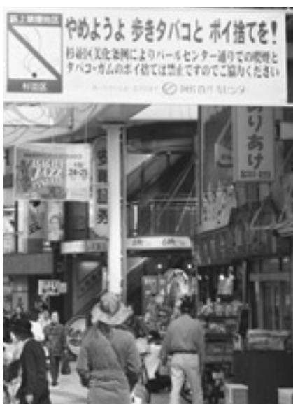
感情をこめて訴えます

10月3日(金)には一年生、三年生、それぞれの学年大会が行われました。これはクラス大会の上位成績者が発表するものです。担当の先生とクラスの子が発表者を含め、内容・音声・態度の三点で採点し選出しました。 発表する内容は生徒ひとりひとりが自由に考えて選びます。小児科医になる自分の夢や自分の心に残っている大切な本について話す生徒もいます。また日々の生活の中で気持ちにゆとりを持つと訴える生徒やいじめを受ける側の気持ちを訴 この日の学年大会では三年生一三名、一年生二名の発表がありました。クラスの代表とあつて、さすがに堂々としています。視線は自分の主張を訴えかけるように聞く側に向けられています。読み方にも感情がこめられています。確実に生徒ひとりひとりの自己表現力は育まれているようです。それぞれの発表の前後には会場から自然と拍手がおきました。 発表した一年生は、「みんなの顔を見てはつきりゆっくり読むようにした。発表が終わわり、緊張感がとれた」、「クラスの代表者なんてできないと思っていたが、終わって達成感が出た」と発表時の緊張していた表情からは一転して、何かをやり遂げた満足そうな笑顔になっていました。