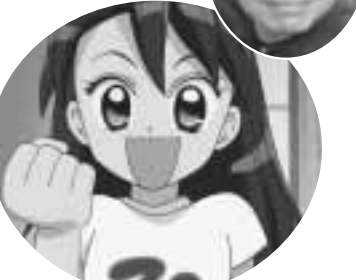
アニメーション制作進行くみちゃん2