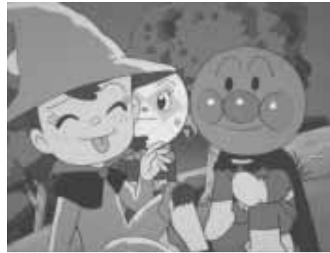
それいけ! アンパンマン