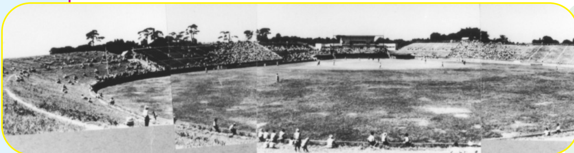
▲外野から見た風景(昭和25年)／上の写真は現在の風景

平成10年2月に開設した、四面の野球場がある運動場、体育館、プール、テニスコート、弓道場などを備える、区内でも最大級の運動施設です。上井草球場を紹介した展示コーナーもあります。