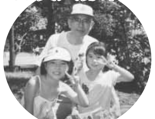
【問い合わせ】まちづくり推進課