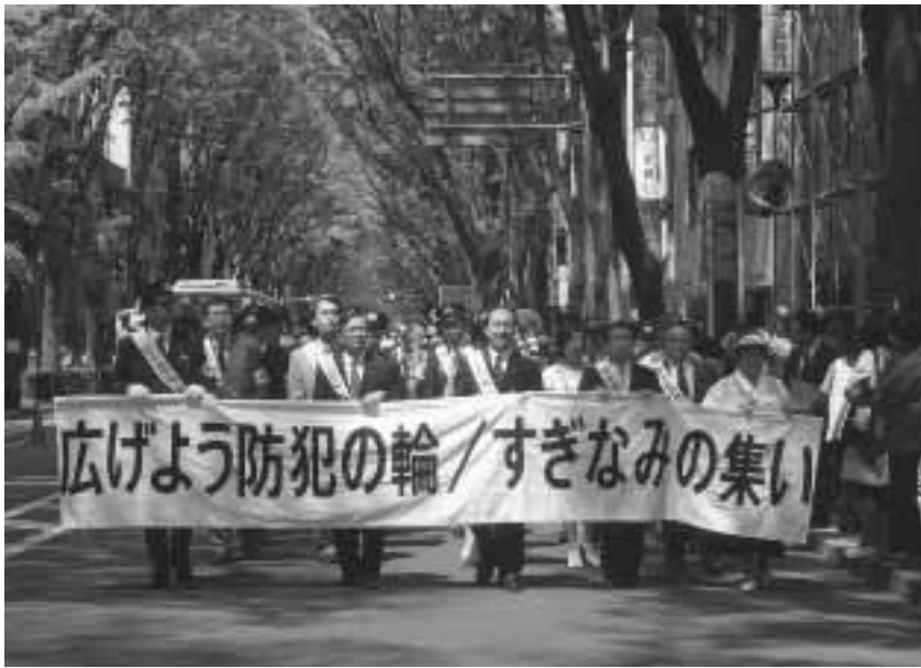
区民とともに防犯の輪を！（4月25日すぎなみの集い）