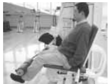
筋力アップ応援教室

筋力アップ応援教室 身体機能が低下し、閉じこもりや寝たきりになるのを予防するため、高齢者向けの機器を利用した筋力トレーニングを行います(4面・講座・講演)中の記事参照。 健康体操 いつまでも健康に過ごすため、月一回テーマを決めて、理学療法士が健康に関する話と体操の指導を行います。 場 敬老会館三三力所(60歳以上の方) 地域ささえ愛グループ 病気や加齢などで家に閉じこもりがちの高齢者などが、生きがいと社会参加や身体機能の維持向上のために自主的な活動を行っているグループです。体操や手工芸・音楽活動など様々な活動を行っています(4月1日現在六八グループ)。 区は、看護師・理学療法士・作業療法士・音楽療法士などを派遣し、活動の支援を行っています。