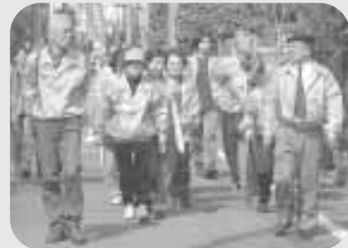
▲松庵東防犯パトロール隊の初出勤(3月27日)

25日の午前中、区民パトロール隊が一斉にまちに出て防犯をアピールします。その後、区役所に集まります。空では、警視庁のヘリコプターが防犯を宣伝しパトロール隊を応援します。