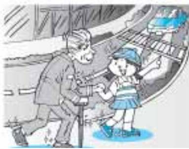
横断歩道を渡りましょう