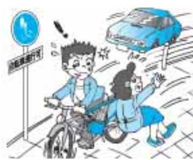
歩行者を優先しましょう

秋の杉並区交通安全運動が始まりました。今年の重点は、次のとおりです。 1 自転車・二輪車の交通事故防止 2 高齢者の交通事故防止 3 夕暮れ時と夜間の交通事故防止対策の推進 4 シートベルトとチャイルドシートの正しい着用の徹底 便利な自転車・二輪車にも落とし穴があります 区内では今年の上半期で、自転車事故が505件(うち死者数1人)、二輪車事故が571件(うち死者数3人)と、昨年より件数が増加しています。特に、二輪車での車線変更などは十分注意して行いましょう。 また、最近、自転車通行可の歩道上で、自転車が歩行者の妨害をするトラブルが目立っています。自転車利用中も歩行者優先を守り、譲り合いの気持ちを持ちましょう。 高齢者の皆さん、道路横断の時は十分注意しましょう 上半期の高齢者の交通事故は、区内で227件と昨年より減少したものの、依然として多く発生しています。 例えば、赤信号での横断や横断禁止場所での横断などが目立ちます。「以前、渡れたから」などと、過去の経験に頼ることは絶対にやめ、みんなの手本になる行動をとりましょう。 また、外出の際は明るく目立つ服装を心がけ、特に夕暮れ時・夜間では、反射材や反射材を用いた衣服・小物を身に着けましょう。 区交通安全対策課または各警察署(杉並 ☎3314 0110 / 高井戸 ☎3332 0110 / 荻窪 ☎3397 0110)