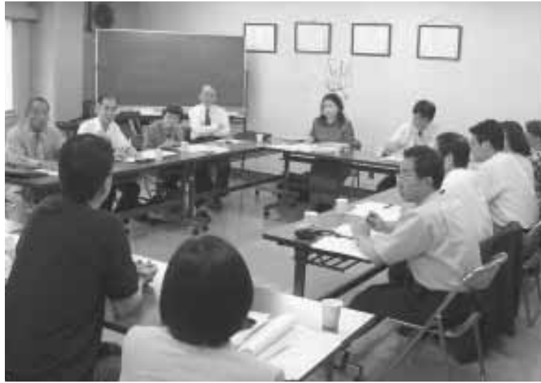
他区の自立支援センターを視察し、利用者の生活状況や就職活動の実際について確認する委員