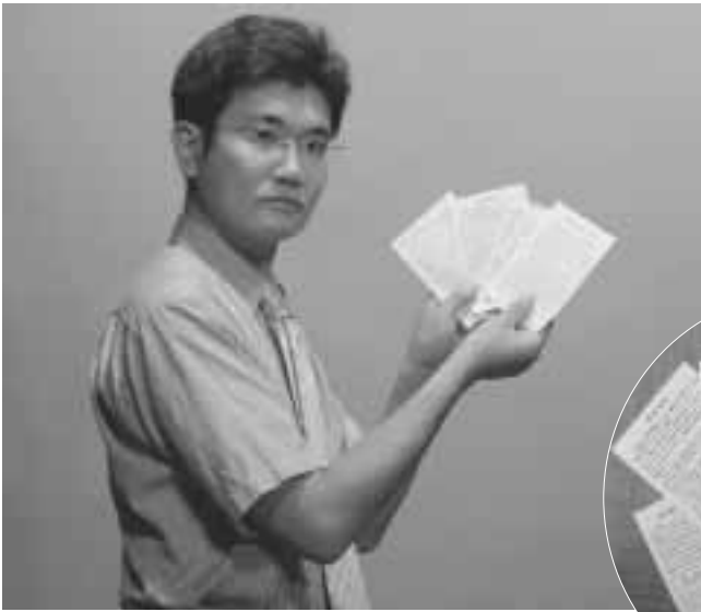
不当な請求は支払いません あの手この手で請求されます