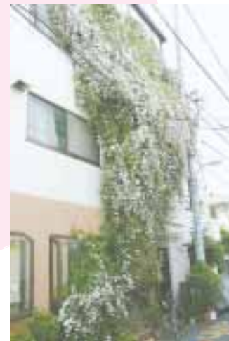
ジャスミン(高円寺南1丁目ユウ美容室) ... 地図