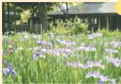
ハナショウブ(妙法寺・堀ノ内3 48 8) ... 地図