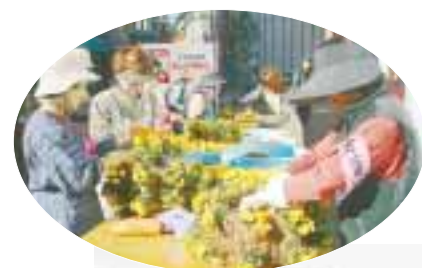
花のバスケット作り

とりどりに植えていましたが、今は色の数を減らしてすっきりしたデザインになりました。また、花が足りないため、フリーマーケットで資金集めもしています。「駅前を通る人たちの気持ちが花で豊かになれば」と、自分の庭のような気持ちで、毎日のように手入れをしています。隊員を募集していますので、お気軽にご参加ください。(連絡先: 火石 ☎3335-3240)