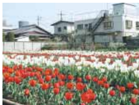
春の名所・チューリップ畑... 地図