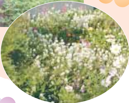
コスモスなど(あんさんぶる牧場屋上庭園・荻窪5 13) ... 地図