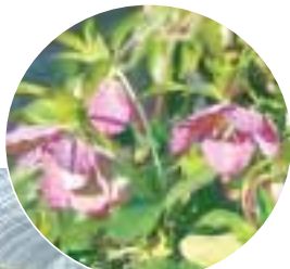
ピニールハウスには出荷を待つ鉢が並ぶ... 地図

海外にも出かけるのですが、世界中に花好きの人がいるので、花の話題で盛り上がり、交流を深めています。また、クリスマスローズの愛好家が全国から買いに来ます。一つとして同じ花がないので、いろいろと交配をして、世界で新しい種類を作りたと思っています。