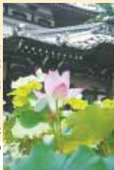
ハス(宗延寺・堀ノ内3 52 19) ... 地図