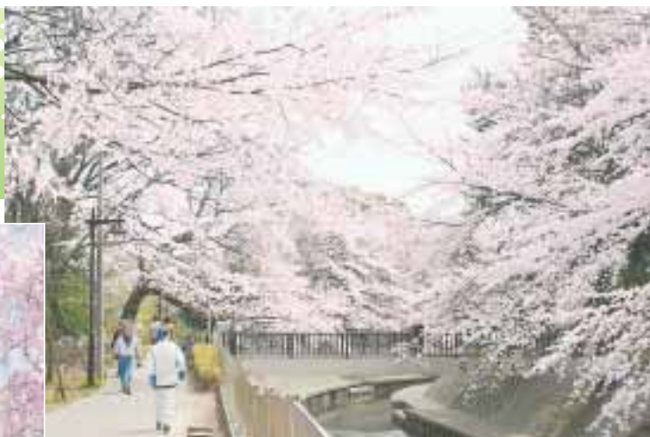
サクラ(都立和田堀公園・大宮2丁目御供米橋付近) ... 地図

区内にはたくさんの花の名所があります。それぞれの季節に訪ねてみてはいかがでしょうか。ここで紹介した場所は、地図中に番号(1~18)であらわしています。