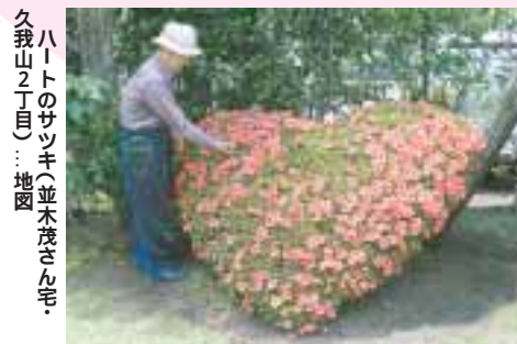
ハートのサツキ(並木茂さん宅・久我山2丁目) ... 地図