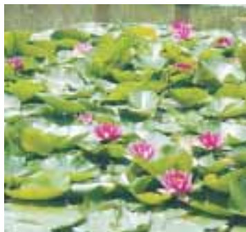
スイレン(都立善福寺公園・善福寺3 9 10) ... 地図