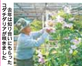
去年は知り合いにももらったコダチダリアが咲きました