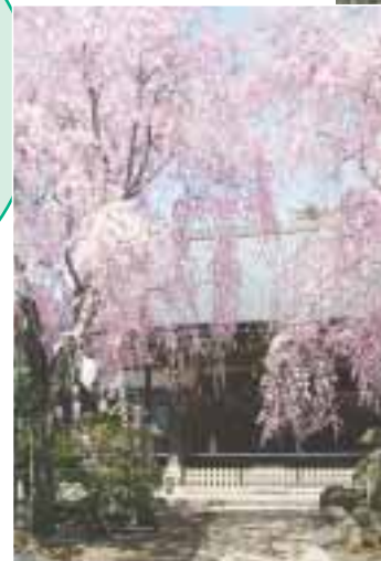
シダレザクラ(妙正寺・清水3 5 10) ... 地図