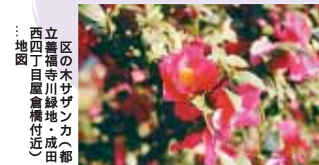
区の木ザンカ(都立善福寺川緑地・成田西4丁目屋倉橋付近) ... 地図