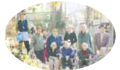
松溪ふれあいの家・花咲かせ隊

近くに小学校があるため、下校途中の小学生が手伝ってくれることもあり、世代を越えた交流が生まれています。