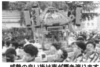
威勢の良い掛け声が響き渡ります

「ソイヤソイヤ」「ワッショイワッショイ」の威勢の良い掛け声とともに、阿佐ヶ谷駅南口広場に向け青梅街道、早稲田通り、川端通りと様々な方面から集まってきました。