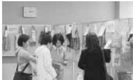
昨年のコンテストの様子

可燃ごみ・不燃ごみ 不法投棄物(家電四品目、バッテリー、消火器などの排出禁止物や自転車)は収集対象外です。 集めたごみの処理 9月26日(月)～10月1日(土)