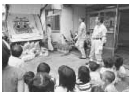
▶清掃車のしくみを学ぶ子どもたち

協賛の謝礼として特設機席を一口につき一席用意します。ただし天候などにより大会が中止になった場合でも、払い戻しはしません。 ☎ハガキに氏名・住所・電話番号・協賛口数(一人四口まで)・観覧希望日(27日か28日)を書いて、7月20日(消印有効・抽選)までにNPO法人東京高円寺阿波おどり振興協会(〒166 0003 高円寺南3 57 10高円寺パルプラザ四階)へ。当選者には払込用紙をお送りします。☎同協会 ☎3312 2728