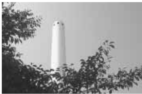
杉並清掃工場の煙突

☎・☎電話、ファクス、ハガキまたはEメールに、住所、氏名(フリガナ)、電話番号、紹介内容と理由(簡単なコメント)も書いて、8月20日(必着)までにまちづくり推進課景観係 FAX3312 2907、✉ matidukuri-k@city.suginami.lg.jpへ(他)月刊『東京人』杉並版(増刊号)は12月に書店で販売予定(700円)です。紹介者の中から抽選で100名にプレゼントします