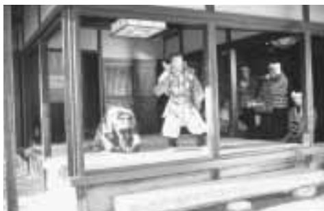
大宮前 はやし 驛子

区では杉並の魅力を区内外に発信するため、都市出版(株)とともにすぎなみカレンダーを折り込んだ月刊『東京人』杉並版(増刊号)を発行します。「あなたが感じた」「あなただけが知っている」杉並らしい風景・歴史・文化・風俗・建築物・人物などをご紹介ください。ご了承いただいた紹介者全員の名前を掲載する予定です。