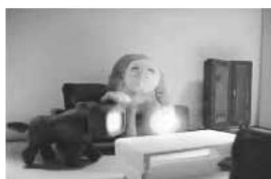
THE MAN IN THE ROOM ©BACA - JA 2005