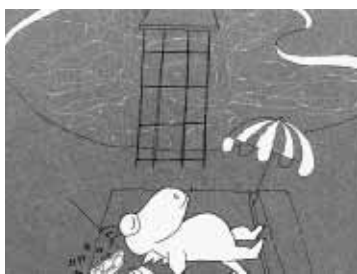
スリーピー ©フルカワタク

実験精神にあふれる作品を送り出し、世界のアニメーション界に強い影響を与えた二人の個人作家の映像を上映します。