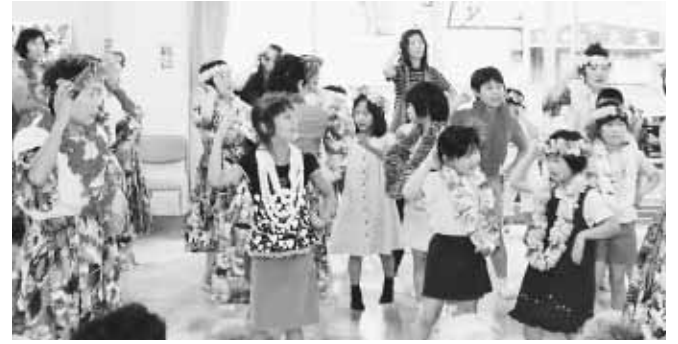
異世代が交流する事業