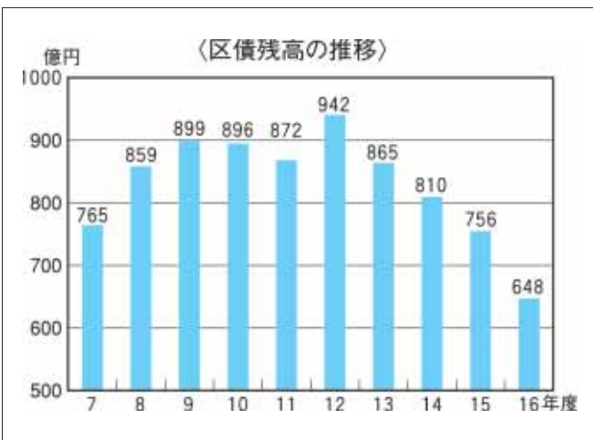
表3 行政コスト計算書 16年4月1日~17年3月31日(単位:百万円)