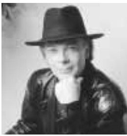
エリック・ベルシヨ

エリック・ベルシヨ「ピアノエレガンス」映画音楽からポピュラー、クラシックまでフランス屈指の名ピアニスト、エリック・ベルシヨが奏でる名曲の美しいメロディをお楽しみください。