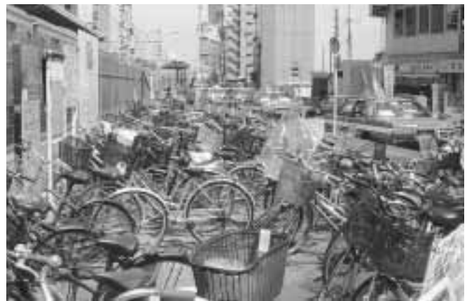
これでは歩道を歩けません(荻窪駅南口)