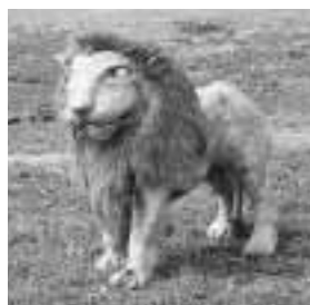
葉っぱがライオンに!

「火力発電所をつくってみよう」ほか、あっと驚く実験がいっぱいです。 午後0時40分～1時25分 分館(株)東芝研究開発センター