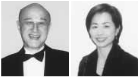
阿川 佐和子 三宅 久之

知的で聡明な女流作家と阿佐谷生まれで杉並第七小学校卒業の日本一の政治評論家による明るく楽しい新春対談です。(区共催)