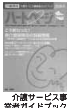
介護サービス事業者ガイドブック

お試ください。 ① ② ③ ④ ⑤ ⑥ ⑦ ⑧ ⑨ ⑩ ⑪ ⑫ ⑬ ⑭ ⑮ ⑯ ⑰ ⑱ ⑲ ⑳ ㉑ ㉒ ㉓ ㉔ ㉕ ㉖ ㉗ ㉘ ㉙ ㉚ ㉛ ㉜ ㉝ ㉞ ㉟ ㊱ ㊲ ㊳ ㊴ ㊵ ㊶ ㊷ ㊸ ㊹ ㊺ ㊻ ㊼ ㊽ ㊾ ㊿