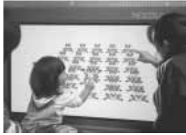
療育支援ソフト「たっちゃんのコネク島」