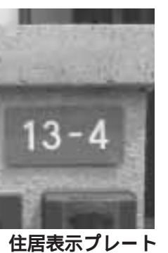
住居表示プレート

3月 対象「方南・和泉・永福地域」区民課管理係 「放射第五号線事業推進のための検討協議会」 専門部会