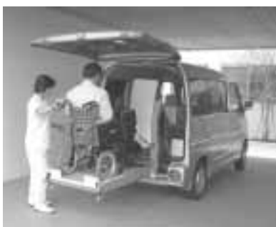
車いすごと利用できる車両

① ② ③ ④ ⑤ ⑥ ⑦ ⑧ ⑨ ⑩ ⑪ ⑫ ⑬ ⑭ ⑮ ⑯ ⑰ ⑱ ⑲ ⑳ ㉑ ㉒ ㉓ ㉔ ㉕ ㉖ ㉗ ㉘ ㉙ ㉚ ㉛ ㉜ ㉝ ㉞ ㉟ ㊱ ㊲ ㊳ ㊴ ㊵ ㊶ ㊷ ㊸ ㊹ ㊺ ㊻ ㊼ ㊽ ㊾ ㊿