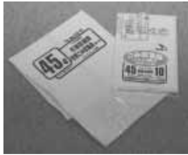
区内で販売されています

カラスは、ごみ袋の中身を見分けてごみをつくといわれています。「黄色いごみ袋」は、特殊な材料を使用して、カラスの視覚を攪乱し、人間には中身が見えるが、カラスには見えない袋です。