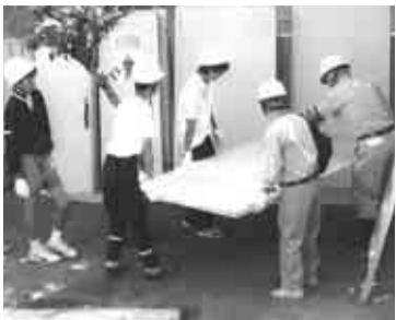
▲カンタン君の組立て

松ノ木防災会のエリアには松ノ木小学校と松ノ木中学校の二つの震災救援所運営連絡会があります。18年度の総合震災訓練の実施について何度も話し合った結果、中学生のボランティア意欲を喚起していくため、中学生にカンタン君の組立てをしてもらおうと考えました。カンタン君とは、区内で一カ