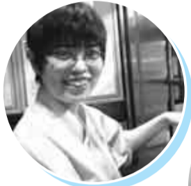
ワークサポート杉並 (財)杉並区障害者雇用支援事業団)の支援で働く皆さん