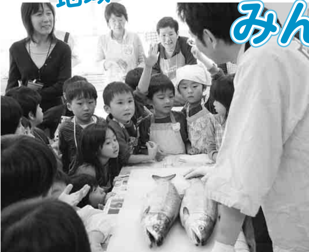
▶岩手産の新鮮なさけとイクラを使った「食育」の出前授業 (高井戸第四小学校)

問い合わせは、杉並保健所健康推進課 ☎3391-1015 または学務課保健給 食係へ。