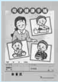
▲該当する母子健康手帳

(杉並区を含む一八区で配付)▽訂正箇所Ⅱ三九ページの男子幼児発育曲線(女子幼児発育曲線になっている)▽訂正用シールⅡ3歳児健診と1歳6カ月健診時に配付。健診時以外でも、希望する方にはいつでも保健センターでお渡しします(☎)保健センター(荻窪 ☎339110015、高井戸 ☎333444304、高円寺 ☎331110116、上井草 ☎33941212、和泉 ☎331319331)