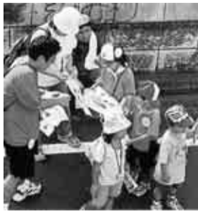
▲知る区ロードの日

9月以降の開催予定※今後の「広報すぎなみ」で募集 ※第1、2、5回は「区政一般について」、第3回は「健康」、第4回は「環境」、第6回は「子育て」の分野からテーマを設定して話し合います。