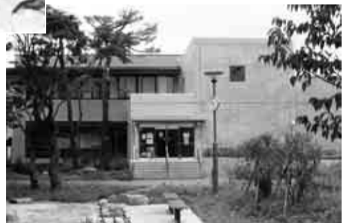
▲落ち着いた雰囲気郷土博物館分館

郷土博物館分館で、杉並の文化人を取り上げた新しい企画展が始まります。分館は、4月に開園した天沼弁天池公園内にあり、池や庭石を配した日本庭園風の園内も楽しめます。皆さん、どうぞお越しください。