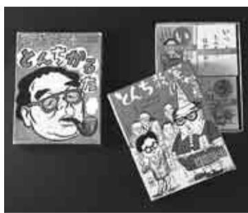
▲とんち教室かるた

▶暮らしのちょっとしたお問い合わせは ☎#8800 または ☎3372-8800 一区役所いつでも電話サービス