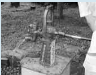
▲震災時生活用水井戸

現在、区民の方に登録いただいた井戸や区立小・中学校と区施設に設置した井戸は、約1000基あります。