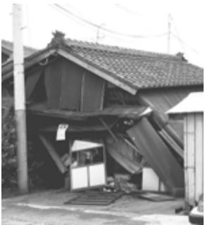
新潟県柏崎市の被害

8月8日(水)午後1時〜4時(毎月一回) 区役所一階ロビー(無料)当日、直接会場へ(他)図面などがある場合は持参してください