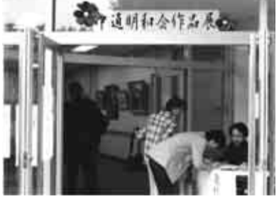
▲にぎわう作品展 (昨年)