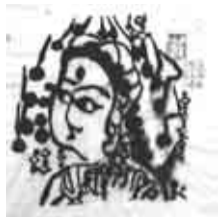
▲棟方志功「瓔珞女観音の棚」(所蔵・写真提供=堺信幸さん)

時 11月2日(金)～20年2月29日(金) 場 中央図書館 (荻窪3-40-23 ☎3391-5754)