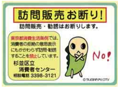
▲訪問販売お断りシール