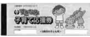
▲杉並子育て応援券

6月から、就学前のお子さんがいる家庭に、ひととき保育・親子コンサートなど有料の子育て支援サービスに利用できる「杉並子育て応援券」(チケット)を交付しています。