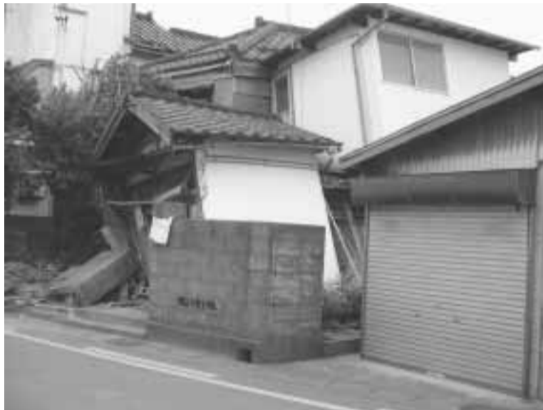
▲新潟県中越沖地震で倒壊した家屋(柏崎市内)

近年、各地で大きな地震が頻発しており、「東京にも大きな地震が必ず来る」といわれれています。しかし、いつ起こるのか予知することは困難です。日ごろから災害に備えておくことで、あなた自身や家族を守ることができま