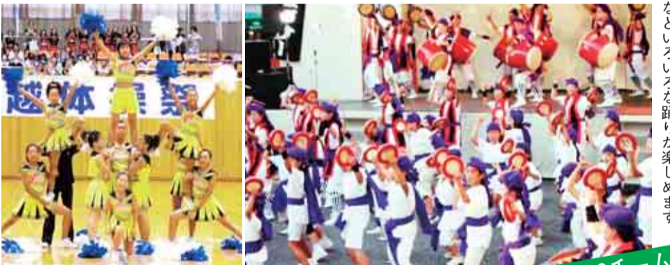
◀ヒップホップ・エイサー・チャリデーニングなどいろいろな踊りが楽しめます