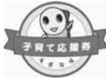
▲応援券事業者は、このマークが目印！

という目的で始めた「子育て応援券」。 応援券をお持ちの方々の積極的な働きかけもあり、現在サービスを提供いただける事業者の数は600を超え、サービスの種類も多岐にわたっています。