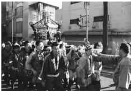
▲12月20日、6カ月ぶりに神輿と再会

町会結成六〇周年の記念事業には、神輿の修復が第一優先と決まり、これに異論を唱える者はありませんでした。