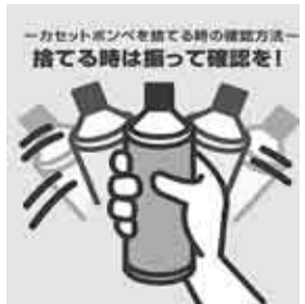
←カセットボンベを揺てる時の確認方法→捨てる時は揺って確認を!

カセットボンベを振って中の音を聞いてください。中身のガスが残っていると「シヤカシヤ」と音がします。