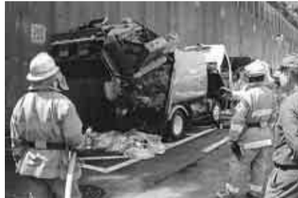
▲火災にあった清掃車両

カセットコンロ用ガスボンベ・スプレーには可燃性の高いガスが使用されています。ガスが残っていると収集車両の火災の原因となり、大変危険です。これらが原因と考えられる車両火災が、区では昨年、一二件も発生しました。