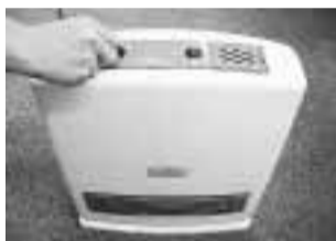
▲温度を低めに設定