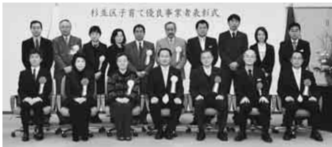
▲1月22日(木)表彰式が行われました