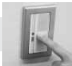
▲スイッチは小まめに切る