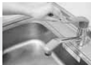
▲蛇口を小まめに閉める

区では18年度に「杉並区地域省エネ行動計画」を策定し、エネルギー消費量の削減を目指し「すぎなみ省エネ作戦」を展開中です。区のエネルギー消費量の約40%を占める家庭での省エネ意識の高まりと実践が、大きな省エネにつながります。