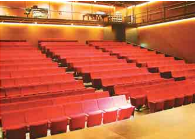
▼座・高円寺2 (区民ホール)