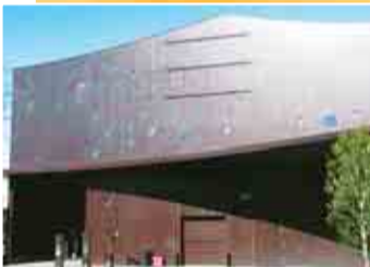
▲座・高円寺の外観(正面入口)