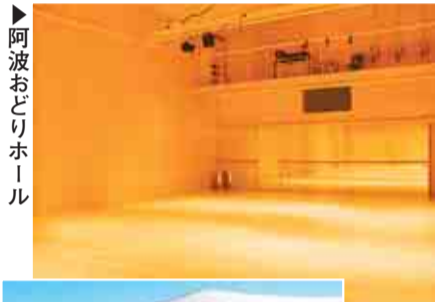
▶阿波おどりホール

用 往復ハガキまたはファクスに、希望するイベント名・住所・氏名(フリガナ)・電話番号・希望参加人数(1件につき2名まで)を書いて、1月15日～2月15日(必着)に座・高円寺プレ・イベント係(〒166-0002高円寺北2-1-2 ☎3223-7501)へ 用 座・高円寺ホームページ http://za-koenji.jp/ からも申し込みます