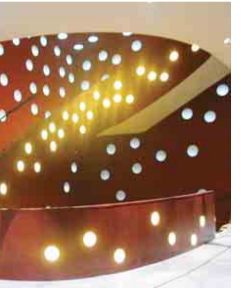
▲世界的な建築家・伊東豊雄さんによる設計