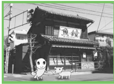
ウェブサイトもあるよ!

かつて杉並の道がまだ馬車道で舗装されていなかったころ、往来の多い通りには、行き来する人の休憩のための茶店や、いなりずし・団子・酒屋などがあり、中には提灯を貸し出す店もあったそうです。