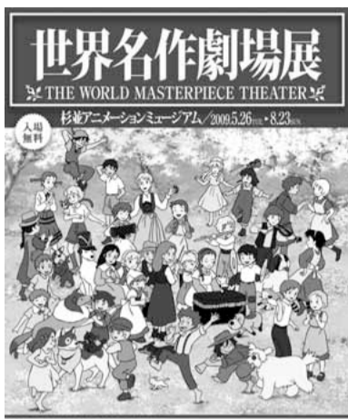
©NIPPON ANIMATION CO.,LTD. "あまのふし" "MAGGIE" "Peter Pan" © Great Ormond Street Children's Hospital Fund "Lassie" © Classic Media, Inc. LASSIE is a registered trademark of Classic Media, Inc. All rights reserved. ©日本アニメーション・フジテレビ

1975年に放送された「ワンダースの犬」から現在放送中の最新作「こんにちわ アン〜Before Green Gables」までの26作品を、貴重な資料や作品年表などの展示、そして館内シアターでのアニメーション上映で振り返ります。また、人気者のラスカルが遊びに来る「キャラクター・グリーティング」や「クイズラリー」など、参加型企画もあります。夏休み期間中ですので、ぜひ、ご家族や友達同士で遊びに来てください。