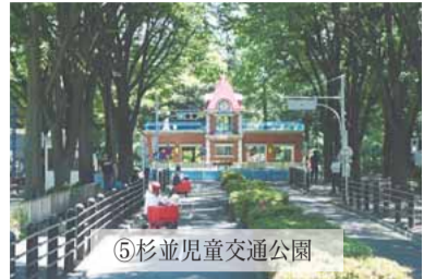
⑤杉並児童交通公園

【使用料】 午前(9時~正午)5600円 午後(1時~5時)7500円 全日(午前9時~午後5時)1万3100円 ※登録団体は減額措置があります。 —問い合わせは、 みどり公園課公園利用係へ。