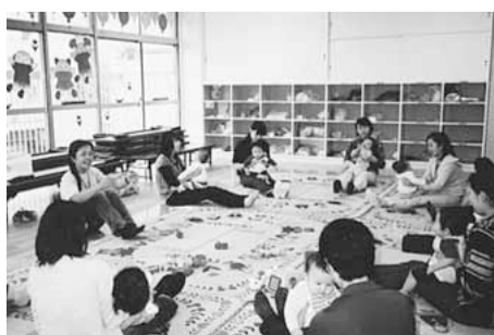
▲地域の児童館での子育て支援

民生委員・児童委員(以下「民生・児童委員」)は、厚生労働大臣から委嘱され、社会福祉全般にわたる地域の身近な相談役として活動しています。