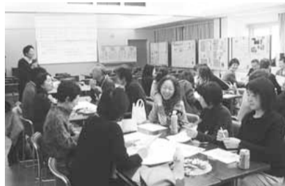
▲合同成果発表会の様子。新たなつながりが続々と生まれています

★公開講座。受講生以外にその都度参加者を募集します。申し込みなどの詳細は、「広報すぎなみ」などでお知らせしていきます。