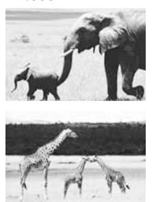
▲迫力ある大自然をお楽しみください