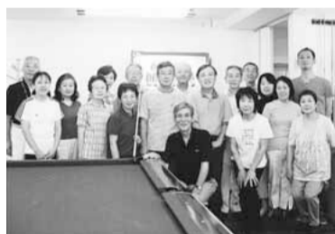
▲ビリヤードにはまっています

当町会は「住み良い町づくりの実現」を目指して活動してきましたが、これからは団塊の世代や新しい住民の眼を町会活動へ向け、参加を促進していくかが問われてきています。こうした中で、「まちの絆向上事業助成金制度」に応募し、助成金を交付していただけることになりました。