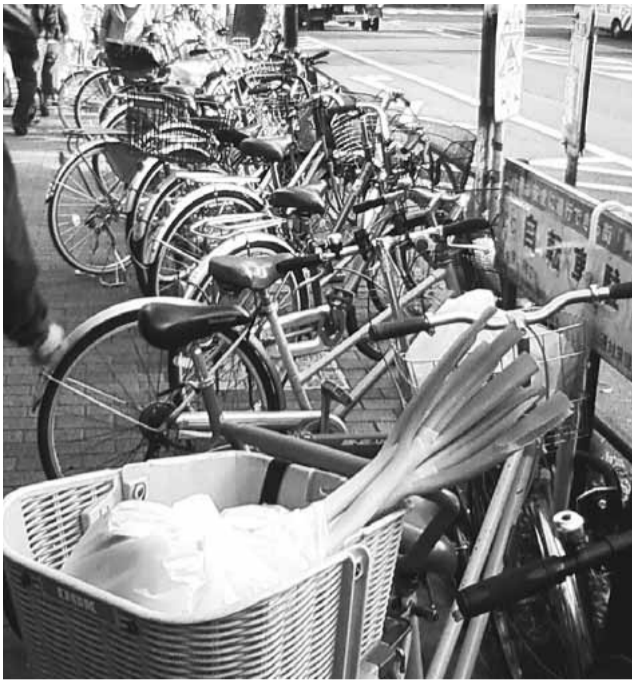
▲放置禁止区域にも多くの買い物客の自転車が放置されています (JR阿佐ヶ谷駅前)