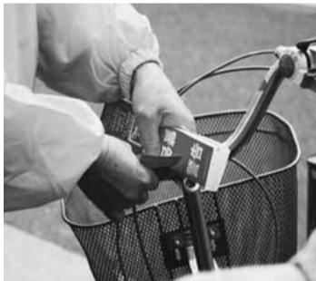
▲放置自転車には協力員が注意札をはり付けます

このような区と住民による協働の取り組みによって、現在では、駅前の放置自転車は年々減少しています。