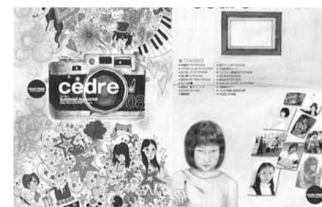
▲Cedre 8号は、図書館・児童館などで配布中です

中学生から20歳程度までの青少年がつくる、同世代に向けた「ゆう杉並」情報誌の企画・編集・デザインなどを行ってみたい方は、委員になりませんか。 ◇区内在住・在勤・在学の中学生▽20歳くらいまでの青少年◇定Ⅱ〇名程度◇無料(活動中の交通費・食料代などは自己負担)◇電話またはハガキ(5面記入例参照)で、6月30日(必着)までに児童青少年課青少年係へ