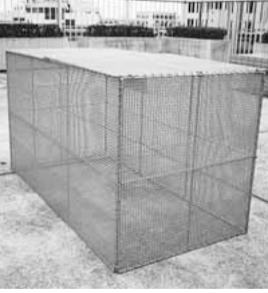
▲折り返し式ごみ収集ボックス