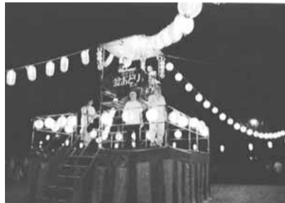
▲毎年大盛況の盆踊り

このほかにも、「街をきれいにすると犯罪者がいなくなる」ということで、生ごみなどがカラス公害に合わぬように、全国で初めて「黄色のゴミ袋」を使用し、街の環境美化に努めています。すべてが「自分の街は、自分たちで守る」という不断の心構えが重要です。