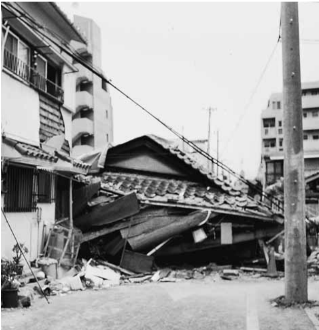
▲地震で倒壊した家屋

地震への備えを怠らず「家」を守りましょう 区では、地震に強い安全なまちづくりの一環として木造住宅やマンションの耐震化を支援しています。 ◇木造住宅の耐震化支援事業 木造住宅の耐震診断・改修は、区の木造住宅耐震診断士の無料派遣から始まります。 [例]昭和56年5月以前に建築した木造住宅の所有者(申)パンフレットにある申込書(区民事務所・分室、駅前事務所、図書館で配布。区ホームページからも取り出せます)を送るとはファクスで、木造耐震診断士派遣事務局 FAX 679 515602へ ◇マンションなどの耐震化支援事業 マンションなどの耐震診断・改修はアドバイザー派遣から始まります。 [例]昭和56年5月以前の鉄筋コンクリート造や鉄骨造の建物の所有者(分譲マンションの場合は、管理組合の代表者)申パンフレットにある申込書 (区民事務所・分室、駅前事務所、図書館で配布。区ホームページからも取り出せます)を郵送またはファクスで、NPO法人耐震総合安全機構 (JASO) FAX 691210773へ ——(いすれも)—— ◇建築課耐震改修担当 「高齢者・障害者世帯の方へ」「家具転倒防止器具」・「火災警報器」の取り付け助成 家具転倒防止器具の場合は家具二、三個程度、火災警報器の場合は二個分の助成です(現金の助成ではありません)。助成を受けるには事前の申請が必要です。 [例]65歳以上の一人暮らしの方、65歳以上のみの世帯の方、「身体障害者手帳」・「愛の手帳」・「精神障害者保健福祉手帳」のいずれかをお持ちの方が「世帯」・「難病患者福祉手当」を受けている方がいる世帯 [例]高齢者の方は、ケア24または高齢者施策課地域連携推進係へ。障害者の方は、障害者施策課障害福祉係または各福祉事務所へ