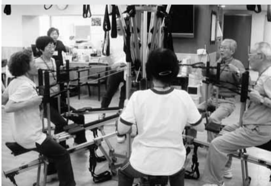
▲高齢者健康講座「おはよう筋力スタジオ」