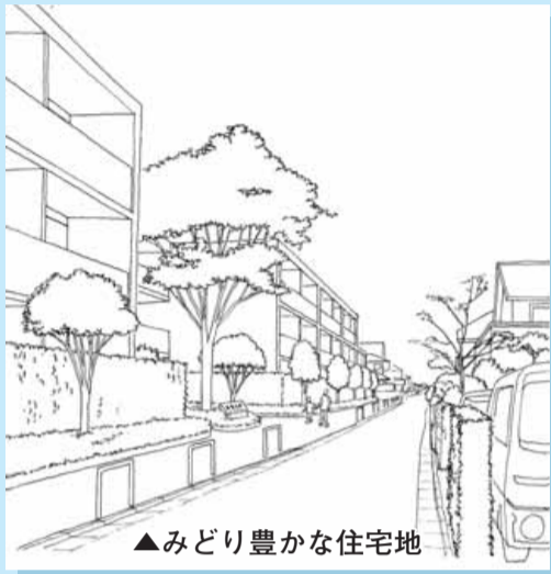
▲みどり豊かな住宅地