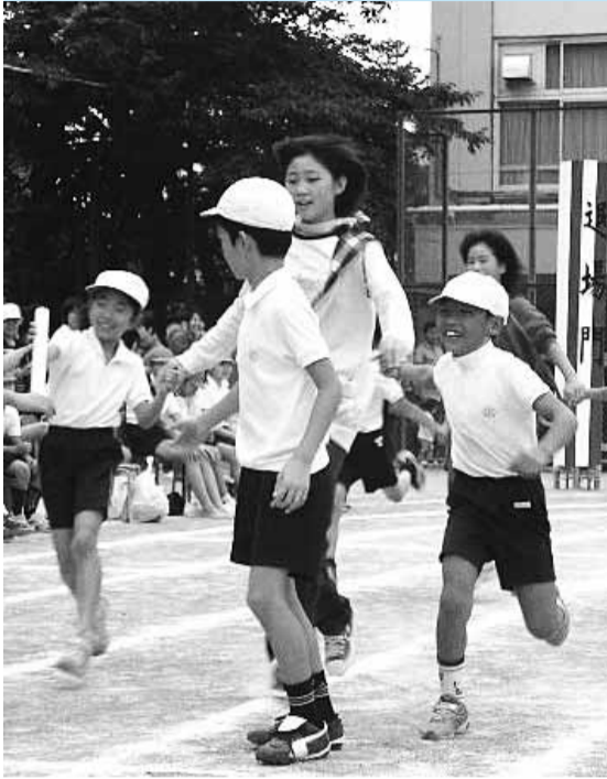
▲小学校の運動会に中学生が参加しました

ご意見をいただきありがとうございます。教育委員会は、義務教育九年間を通して児童・生徒の学びの連続性を保障した教育活動を推進するため「杉並区小中一貫教育基本方針」の策定について、検討を進めてきました。