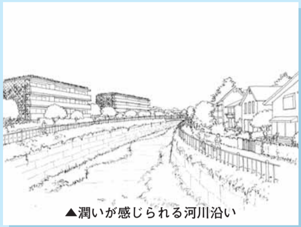
▲潤いが感じられる河川沿い

杉並区景観計画(案)は、「杉並の魅力ある景観づくりのあり方」(19年3月杉並区景観づくり懇談会提言)を踏まえ、杉並区の景観の将来像や基本理念、景観法を活用した景観づくりなどを具体的に示したものです。このたび、その内容をお知らせし、「杉並区自治基本条例」に基づく区民等の意見提出手続により、皆さんのご意見を伺います。——問い合わせは、まちづくり推進課へ。