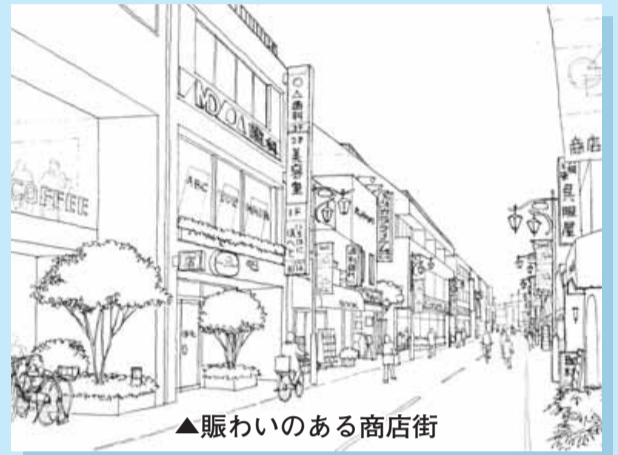
▲賑わいのある商店街