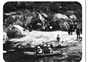
▲カヌーなど大自然を満喫できます

★美術館等施設=入館する際に、区内在住であることが確認できる書類を提示してください。