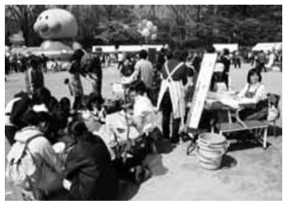
▲毎年大盛況の蚕糸の森まつり

昭和61年、蚕糸の森公園は防災公園として開園しました。ここを地域コミュニティ形成の場として、周辺の各団体が第1回のまつりを開催したのが、昭和63年3月でした。防災や環境など多くの目的を持って三五団体でスタートした協議会も、現在は五五団体の皆さんが手弁当で頑張る「蚕糸の森まつり」となりました。 毎年一万人以上の来場者があり、初めは閉会後のごみが七〇〇袋で一五〇袋もありましたが、多くの協議を重ね「ゴミゼロ」を目指し、可燃ゴミは多くても四五〇袋二つくらいで、各自が持ち帰るようになりまし。資源を大切に、環境の浄化を考えようとの熱い思いを語り合い続け、このよな結果となりました。これは、このまつりの特筆すべきことだと思っています。 当日は関係団体のお手伝いだけでも、二〇〇名位は参加していますが、災害時には、まつりを通して培ってきたスタッフたちの連携と協力で、被災者にとって、大変に力強