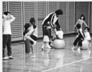
▲協働事業(親子で遊ぼう)

以前より「名前からはどんな団体なのか分かりにくい」という声が寄せられていました。このため、20年に7つの協議会と区が「地域集会施設等運営協議会のあり方検討委員会」を設置し、活動拠点である地域区民センターの名前をつけるよう名称変更するとともに、今後、地域で活動するさまざまな団体と協働で、課題解決にあたる事業を展開しながらネットワークを形成し、中心的役割を担うこととしました。