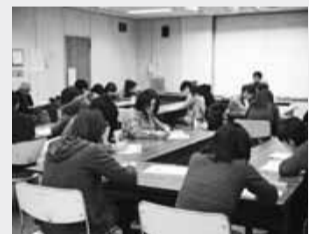
▲協働事業(健康フォーラム)

地域のさまざまな公共的団体(町会・自治会、青少年育成委員会、福祉団体、小中学校のPTA、NPO法人など)や民生委員などの専門委員からの推薦を受けた方、公募により選出された委員により構成されている任意団体です。委員は全員がボランティアです。