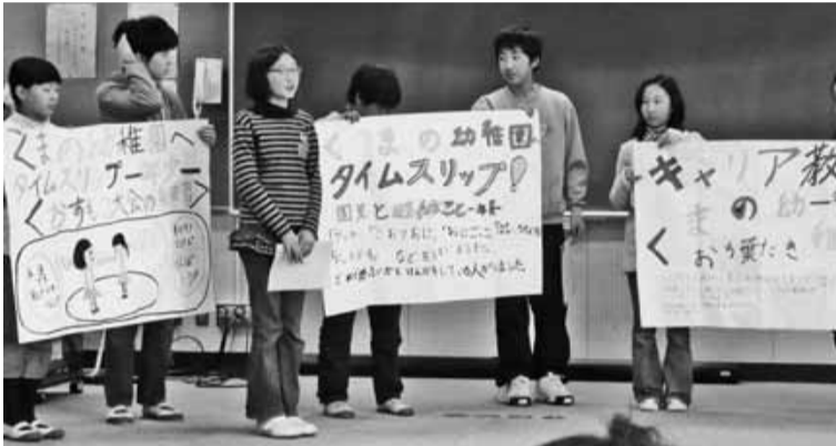
▲小中一貫教育研究発表会 小・中学生交流授業の様子