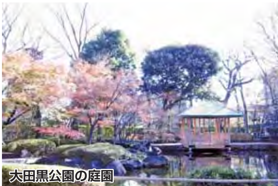
大田黒公園の庭園

1月2日(日)・3日(月)に、大田黒公園を開園します。静かな日本庭園で、新しい年のひと時を過ごしてみませんか。 2日(日)は、先着100名に絵ハガキを差し上げます。 時開園時間=午前9時～午後5時 大田黒公園 ☎3398-5814