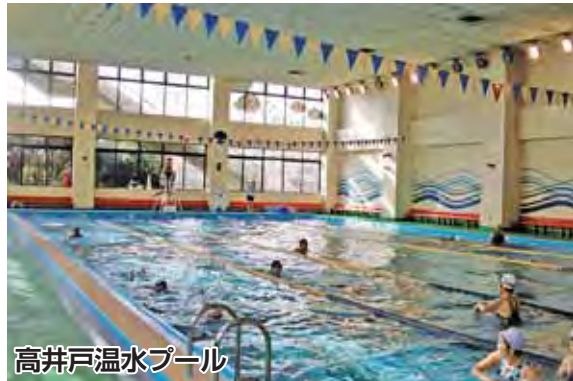
高井戸温水プール

お正月太り解消プログラムなど、思わず食べ過ぎてしまうこの時期にピッタリの講座をご用意しています。また、親子で楽しめる講座もありますので、ぜひ、遊びに来てください! イベントの詳細は、下表をご覧ください。 ☎各体育施設