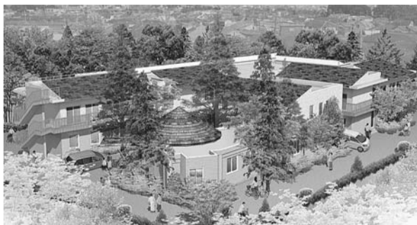
▲ジャパンケアサービス多機能施設堀ノ内

ジャパンケアサービス多機能施設堀ノ内(堀ノ内2-19)は、認知症高齢者グループホーム(定員18名)、ショートステイ(定員20名)、認知症対応型デイサービス(定員12名)の複合施設です。