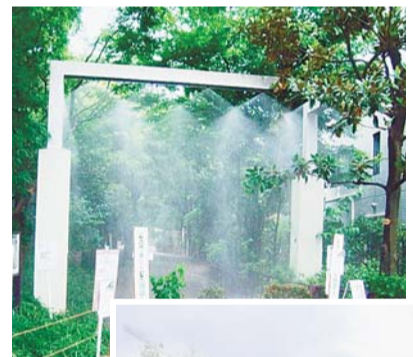
◀ 蚕糸の森公園のゲートシャワー(作動時)