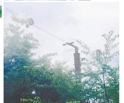
▶ 井草森公園の放水銃(作動時)