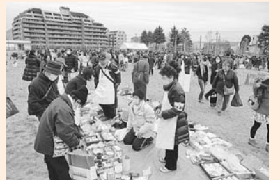
▲チャリティーバザーで物品を販売しました

4月3日(日)に桃井原っぱ公園で行われた南相馬市支援チャリティーバザーでは、民生委員・児童委員も支援活動の一環として、事前の物品受付や値段付け、当日の販売などにボランティアとして参加しました。