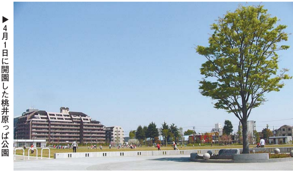
▶ 4月1日に開園した桃井原っぱ公園