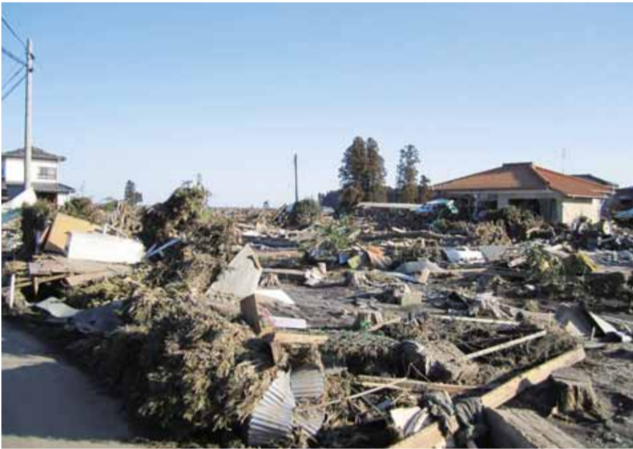
▲南相馬市の様子 (3月18日)

東日本大震災で、区と交流があり「災害時相互援助協定」を締結している福島県南相馬市に甚大な被害が発生しました。区は、被災地への必要な支援に全力を尽くしていきます。