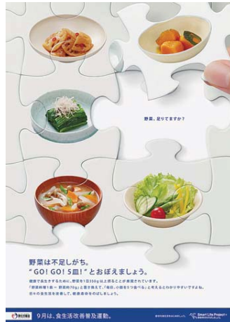
野菜は不足しがち、「GO!GO!5皿」とおぼえましょう。 健康で生活するために、野菜を1日350g以上とることが推奨されています。 「健康長寿」・「糖尿病予防」をテーマに、「みんなの栄養展」も同時開催します。 園中野区健康推進課(荻窪5-20-1)で実施いたします。

園10月29日(出)午前10時～正午 園区内ヘルシーメニュー推奨店(詳細は、杉並ウエストサイズ物語ホームページや保健所・保健センターで配布するチラシでお知らせします) ①直接、ヘルシーメニュー推奨店へ園杉並保健所健康推進課栄養指導担当 ☎3391-1015 ②食育シンポジウム実行委員会との共催事業です