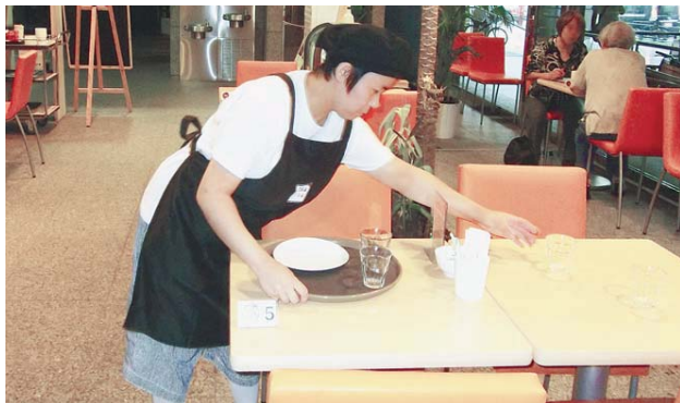
▲区役所1階FikaFikaで働いています