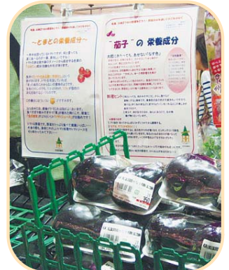
▲スマート食育応援キャンペーンに協力いただいた八百屋さんでの栄養・健康情報の提供