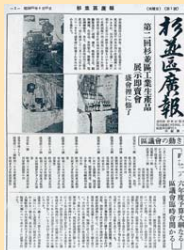
杉並区広報創刊号

また、今年10月に区は区制施行80周年を迎え、さまざまな記念事業を区民の皆さんと共に行います。「広報すぎなみ」でも随時、紹介していきますので、ご参加ください。