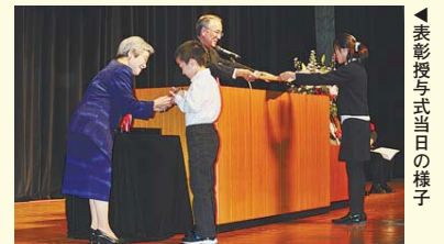
▲表彰授与式当日の様子

区では、「心温まる行い」や「勇気ある行い」をした青少年を表彰しています。23年度の杉並区青少年表彰授与式は、23年11月27日(日)にセシオン杉並ホールで行われ、下記の皆さんが区長から表彰されました。青少年表彰制度では年間を通して推薦を受け付けています。青少年に親切にしてもらい助かったこと、感心させられたことなどがありましたら、ぜひ推薦してください。 ——問い合わせは、児童青少年課 ☎3393-4760 へ。