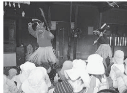
▲昨年の豆まきの様子

⑩ 2月3日(金)午前11時～11時30分 郷土博物館(大宮1-20-8) ☎100円(観覧料。中学生以下無料) 申込当日、直接会場へ ☎郷土博物館 ☎3317-0841