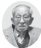
前編は23年12月21日号に掲載しています

さまざまな分野で活躍された後も、自分の個性を発揮していきたいと活動されている杉並区にお住まいの方を紹介いたします。