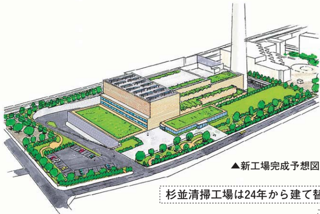
▲新工場完成予想図

杉並清掃工場（高井戸東3-7-6）は、1月末をもって、ごみの搬入を停止して建て替えの準備に入ることになりました。新工場が完成する平成29年まで、他区の清掃工場にごみを運ぶことになります。このため、新たにごみを運ぶ工場の距離や交通事情により、これまでの収集時間が前後する場合があります。ご迷惑をおかけしますが、ご理解とご協力をお願いします。 なお、地域の皆さんや関係者の方のこれまでのご理解・ご協力に対して感謝の気持ちを込め、ごみの搬入停止の式典を行います。——問い合わせは、杉並清掃事務所 ☎3392-7281 または 杉並清掃事務所方南支所 ☎3323-4571 へ。