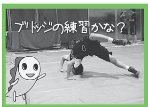
ウェブサイトで見るよ! すぎなみ学 検索

皆さんは「格闘技」と聞いてどんなことを想像しますか? ここ杉並区では、子供から大人まで気軽に体験できる格闘技の教室やサークルが活発です。