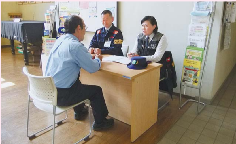
▲防犯に関する相談を受け付けています