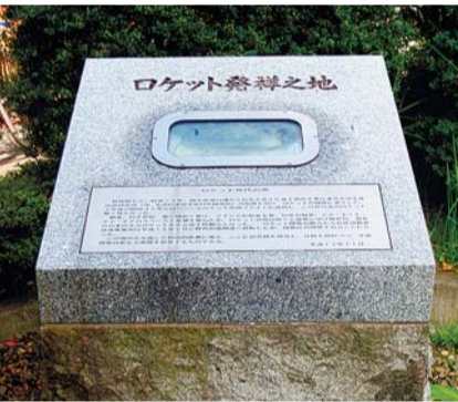
桃井にあった中島飛行機東京工場。 富士精密工業、プリンス自動車、日産を経て、現在は記念碑のみが残る。

始まりは大正14(1925)年、中島飛行機東京工場の誘致である。零戦はじめ戦闘機のエンジンを作る中島飛行機は、杉並の暮らしを一変させた。社会基盤の整備が一気に進み、地元雇用を生んだばかりでなく、数千人もの従業員が転入。商店街も大きくなり、周辺地域は一つのまちとして発展していったのである。中島飛行機は戦後GHQにより解体されたが、その高い技術は自動車産業へと継承。これらの技術は、日本初のロケット開発をはじめ、さまざまな分野で活かされたのである。