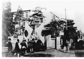
昭和7年10月1日 杉並区誕生

杉並区の誕生から80年を写真や広報紙を通じて振り返ります。 時 9月5日(水)～11日(火)午前9時～午後5時(土・日曜日を除く) 場 区役所1階ロビー 費 無料 申込 当日、直接会場へ 関 広報課 他 各日先着50名の方にオリジナルポストカードを差し上げます