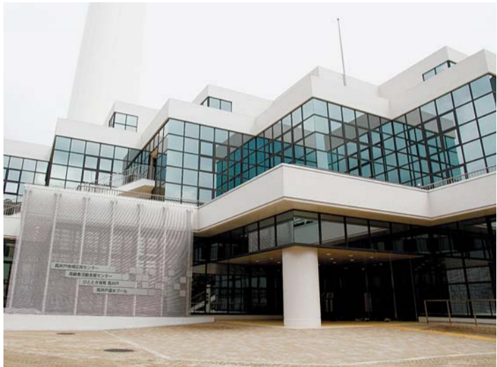
▲高齢者活動支援センター（高井戸東3-7-5）は高井戸地域区民センター、高井戸温水プールなどとの複合施設で、今年5月にリニューアルオープンしました