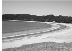
▲白砂青松の弓ヶ浜

時9月12日(水)午前10時～午後2時(売り切れ次第終了)場区役所中杉通り側入り口前内試食サービス＝黒蜜・酢醤油トコロテン、伊勢海老味噌汁(先着100名)、干物(アジ・金目だい)▷販売コーナー＝海産品＝乾物(わかめ・ひじきなど)、干物(アジ・金目だい)ノ農産品＝地元野菜などノ特産品＝アロエ製品、メロン最中、メロンロール、温泉塩あめ申込当日、直接会場へ☎文化・交流課交流推進担当☎買い物袋を持参してください