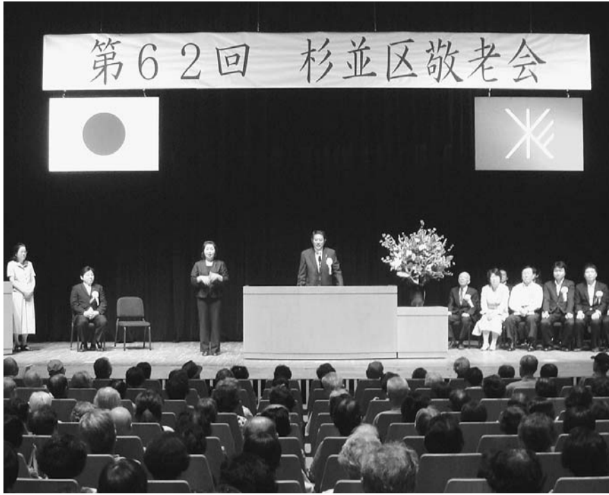
▲23年度杉並区敬老会 (今年度の敬老会の申し込みは終了しました)