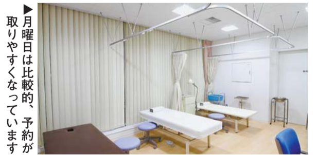
▶月曜日は比較的、予約が取りやすくなっています