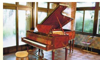
▲故大田黒元雄氏が愛用したピアノ

時11月3日(祝)午後1時～2時30分 大田黒公園(荻窪3-33-12) 内出演=高橋悠治(ピアノ)▷曲目=モーツァルト「ロンドイ短調」ほか定40名(抽選)費2000円(申込)往復ハガキ(9面記入例参照。2名まで連記可)で、10月22日(必着)までにまちづくり推進課景観係へ同係(当選後のキャンセルはできません)