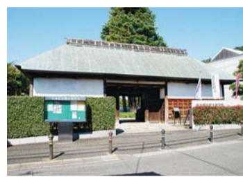
▲旧井口家住宅長屋門

旧井口家住宅長屋門(杉並区)と旧谷岡家住宅表門(世田谷区)を見学する、世田谷区との合同解説会を行います。建物の見どころや長屋門があった地域の歴史環境など、ふたつの長屋門の特色について分かりやすく解説します。