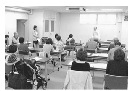
▲天沼二丁目三よし会「組長会議」

町会名がア行のAで始まり、数字が二、三と続く語呂の良さ。好きな町会名です。「三よし」とは、「明るい」「仲のよい」「暮らしよい」に由来し、この三つは私たちがいつの時代にも日々の生活を営む上での基本であり、そのことを心掛けるながら歩んで来た町会の歴史を誇りに思っています。 私が町会長に就任した直後に「3・11東日本大震災」が発災し、最初はその猛威をほうぜんと感じていた私も、翌々日には町会の役割の重大性を痛切に感じていました。 日本は世界一の地震国であり、地震発生率は世界平均の80倍というものですが、恵みも大きく、美しい山河と景観、豊かな温泉、肥沃な大地と海岸線など、感謝しても尽きることのないほどで、国家の財産であると考えています。 ところが最近、首都直下型地震の脅威が大きく加わり、深刻さの方は一段と増しています。 並ぶように、「荻窪駅周辺まちづくり」計画が登場して