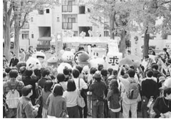
▲昨年も多くの人でにぎわいました

10月27日(土)・28日(日) 場座・高円寺、高円寺北公園、高円寺中央公園、杉並第四小学校体育館、JR高円寺駅南北広場、高円寺各所のストリート、ライブハウスなど 費無料(一部有料あり) 申込当日、直接会場へ 高円寺フェス実行委員会事務局 ☎3313-5589 詳細は、高円寺フェスホームページ http://koenjifes.jp/index.html をご覧ください