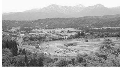
▲おぢやクラインガルテンふれあいの里

滞在型農園「おぢやクラインガルテンふれあいの里」の25年度新規利用者を募集します。「田舎暮らしに興味はあっても移住するのは心配」、「田舎暮らしをお試しで体験したい」という方に農園付き宿泊施設(一戸建て)を貸し出します。田舎の自然に囲まれながら、野菜や花を育てる生活を始めてみませんか。農作業が初めての方でも地元の農業指導員がサポートするので安心です。 場 おぢやクラインガルテンふれあいの里(新潟県小千谷市大字塩殿甲1814-2) 内 使用期間=1年(5年まで更新可)▷利用料=年間39万6000円(別途光熱水費等) 申 込 ・ 関 電話またはEメール(記入例参照)で、新潟県小千谷市農林課農村支援係 ☎0258-83-3510 関 nourin-nk@city.ojiya.niigata.jp へ 他 詳細は、リーフレット(文化・交流課(区役所西棟10階)で配布)または小千谷市ホームページ http://www.city.ojiya.niigata.jp/ をご覧ください