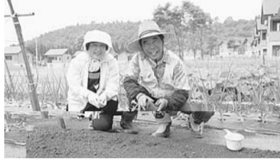
▲ふれあいの里の皆さん

る方とその家族、関係者 費 無料 申 込 当日、直接会場へ 関 地域生活支援係「オブリガード」 ☎3391-1976 FAX3391-1977